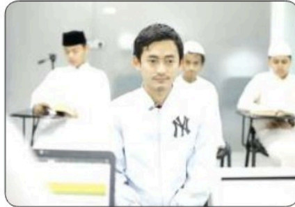
■ أحد المشاركين بالمسابقة