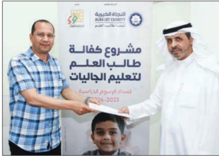
أمانة الأوقاف تدعم تعليم طلبة العلم ضيوف الكويت

الدراسية لـ 436 طالباً من الأيتام وأبناء الأسر المتعففة داخل الكويت، خلال الفصل الأول من العام الدراسي 2023-2024، من خلال تبرعات المحسنين، إضافة إلى التعاون والشراكة مع المؤسسات المانحة.