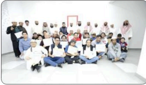
■ جانب من الفائزين بالمسابقة