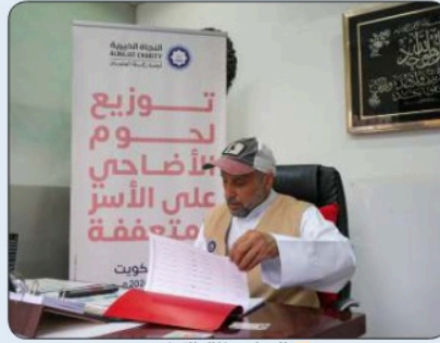
المطوع خلال التوزيع

المحسنين لاستمرار العطاء لمشاريع زكاة العثمان مذكراً بقول الله تعالى: مَثَلُ الَّذِينَ يُنْفِقُونَ أَمْوَالَهُمْ فِي سَبِيلِ اللَّهِ كَمَثَلِ حَبَّةٍ أَتَتْتِ سِتْعَ سَنَابِلٍ فِي كُلِّ سَنَابِلَةٍ مِائَةٌ حَبَّةٌ وَاللَّهُ يُضَاعِفُ لِمَنْ يَشَاءُ وَاللَّهُ وَاسِعٌ عَلِيمٌ . مبينا أن التبذير يكون عبر الاتصال على 99401011 - 99388878. أو زيارة مقر اللجنة بحولي.