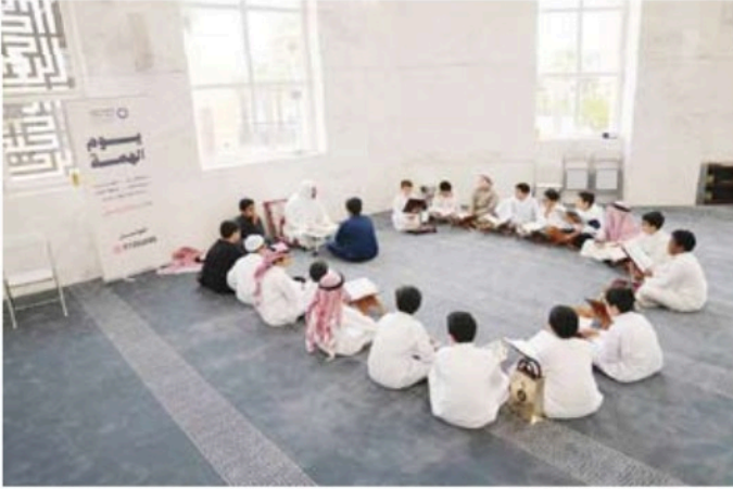
إحدى الحلقات في يوم الهمة